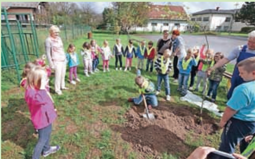
Sajenje drevesa v Zalogu / Foto: Lilijana Skubic

umaknil soncu. Naš tulipanovec iz leta 2008 pred šolo je tako zrasel, da si komaj predstavljamo, da je star komaj sedem let. Ambrovec, ki smo ga sadili kot prijateljsko drevo iz Malezije v letu 2010 pa je v letošnjem letu zrasel za skoraj en meter,« nam je o šolskem parku dreves povedala Lilijana Skubic in dodala, da je bilo prvošolcem najbolj všeč, da sta jih obiskala župan in gospod Strupi ter da je to drevo zdaj njihovo, zato bodo zanj lepo skrbeli. J. P.