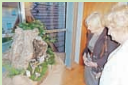
Obiskovalce so navdušile tudi jaslice s kombinacijo čipk in lesa.