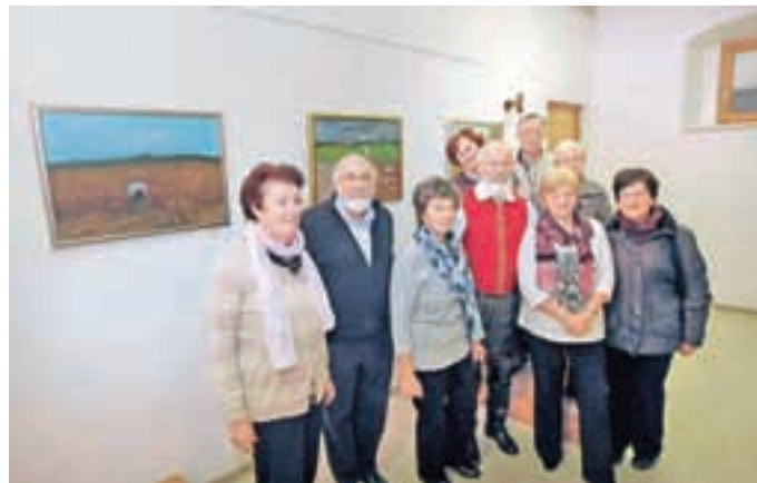
Člani društva likovnikov Cerklje so se znova pridružili projektu likovnikov iz Naklega.

V župnijski dvorani v Cerkljah je bila tri dni na ogled že tretja skupna razstava likovnikov iz Cerkelj in Naklega z naslovom Narodne v sliki, pesmi in besedi.