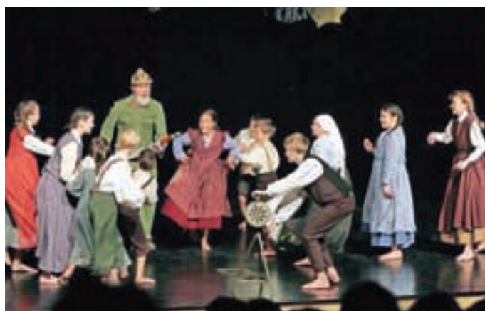
Otroška folklorna skupina OŠ Davorina Jenka Cerklje na Gorenjskem