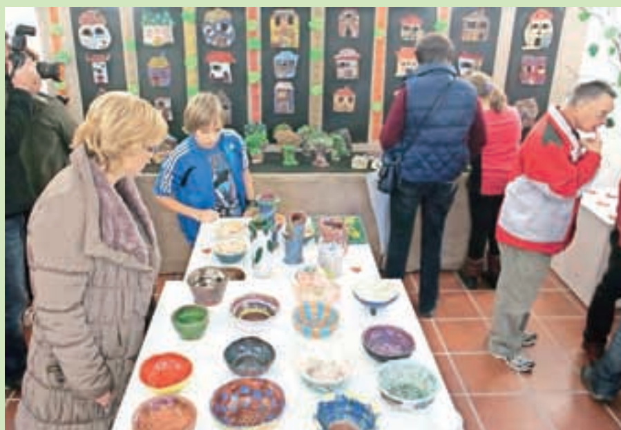
V Petrovčevi hiši so bili na ogled najrazličnejši izdelki iz gline, ki so nastali na krožku keramika.

Davorinu Jenku v spomin so učenci cerkljanske šole v Petrovčevi hiši pripravili razstavo keramike. »Učenci pri oblikovanju z glino uživamo. Zelo radi obiskujemo krožek keramika, ki ga na naši šoli že vrsto let vodi mentorica Maja Zajc Sobočan. Vzdušje med delom je sproščeno, a umirjeno. Spoznali smo že celo vrsto tehnik oblikovanja gline, predvsem pa nas navdušujejo različni načini obdelave površine, kot so glaziranje, engobiranje, zanimive krasilne tehnike s podglazurnimi barvami. Najbolj smo vznemirjeni, ko polni pričakovanja odpiramo peč. Kakšni bodo naši izdelki? Kako so prestali peko? Velikokrat smo prijetno presenečeni in zadovoljni z izidom. Svoje izdelke odnesemo domov, včasih jih tudi komu podarimo,« pravijo mladi umetniki, ki so obiskovalcem razstave dokazali, da jim gre oblikovanje gline res dobro od rok. J. P.