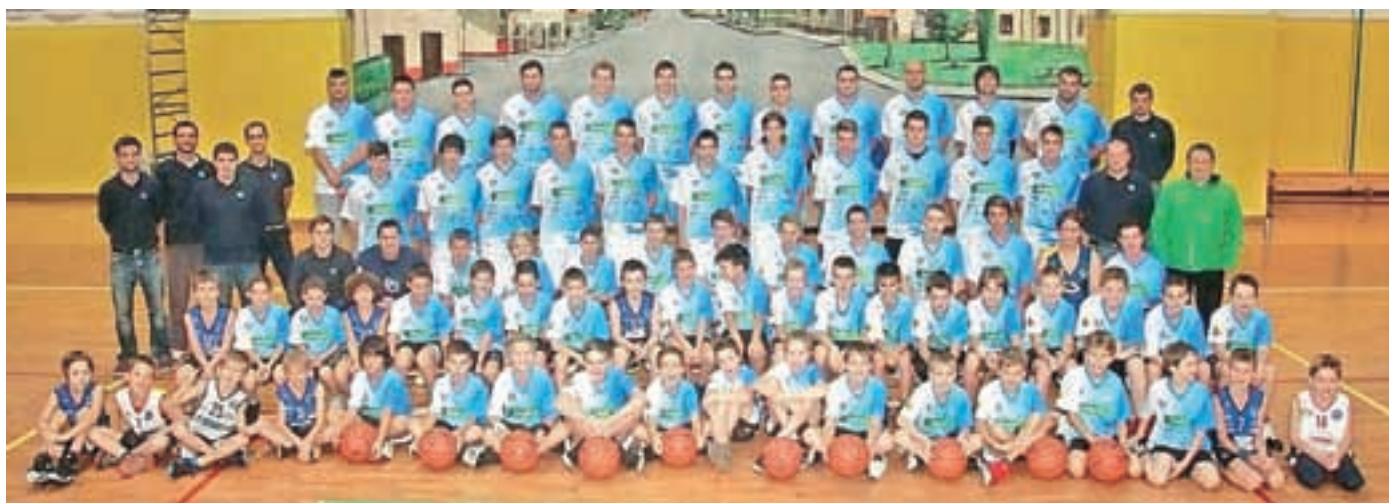
Košarkarji vseh starostnih kategorij ŠD Krvavec