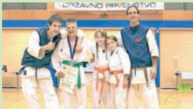
Skupinska fotografija predstavnikov Karate kluba Cerklje po koncu državnega prvenstva

V januarju 2015 bo v klubu potekal vpis novih članov tako v skupino cicibanov (5–7 let) kot tudi v skupino dečkov in deklic začetnikov