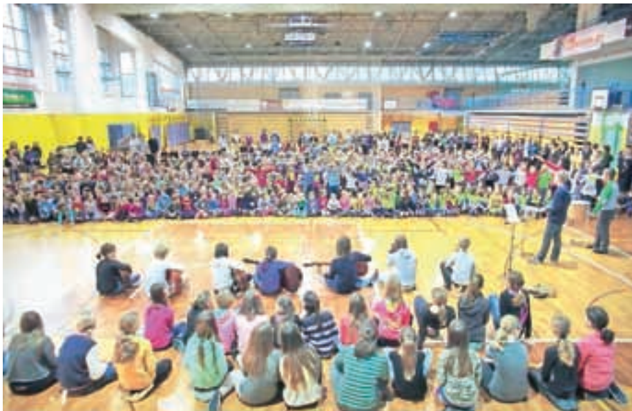
Pesem Lipa zelenela je je zapelo več kot sedemsto učencev in učiteljev.

Na visok jubilej bo na šoli v Cerkljah odslej spominjal tudi Jenkov kotiček, ki so ga na